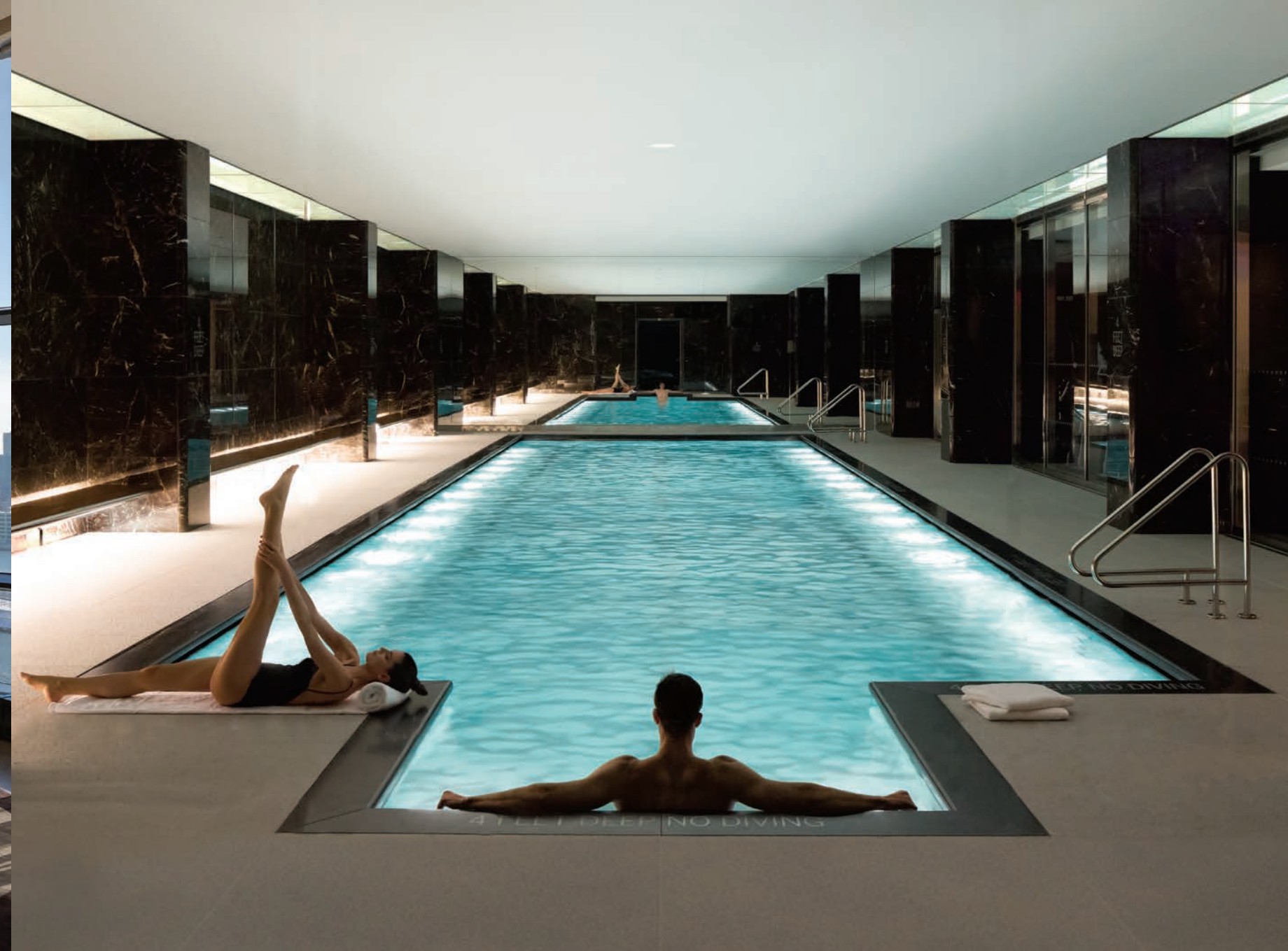
УДОБСТВА И РАСПОЛОЖЕНИЕ

Простор, свет и несравненный вид из окон - это истинная роскошь для Нью-Йорка, к которой стремятся все, но которая так редко бывает достижима. Мастерски спланированное конструкторами Foster + Partners расположение кондоминиумов позволило не оставить ни одну квартиру без уголка, из которого открывается вожделенный вид; глубокие выступающие эркеры с большими окнами дают достаточно света и обрамляют несравненный панорамный вид на Ист-Ривер и линию горизонта за Манхэттеном. Центральную композицию этого кинематографического фона составляют здания Крайслер-билдинг, Эмпайр-стейт-билдинг и здание штаб-квартиры ООН.