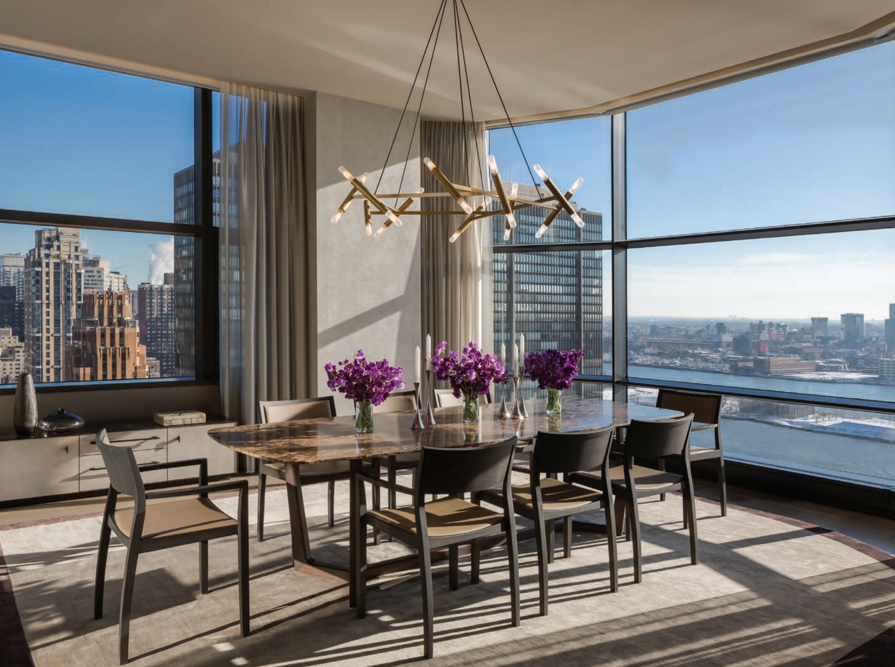
ВИД ИЗ ОКОН

Простор, свет и несравненный вид из окон - это истинная роскошь для Нью-Йорка, к которой стремятся все, но которая так редко бывает достижима. Мастерски спланированное конструкторами Foster + Partners расположение кондоминиумов позволило не оставить ни одну квартиру без уголка, из которого открывается вожделенный вид; глубокие выступающие эркеры с большими окнами дают достаточно света и обрамляют несравненный панорамный вид на Ист-Ривер и линию горизонта за Манхэттеном. Центральную композицию этого кинематографического фона составляют здания Крайслер-билдинг, Эмпайр-стейт-билдинг и здание штаб-квартиры ООН.